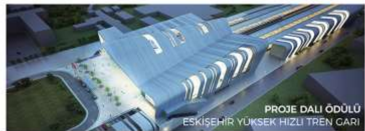
PROJE DALI ÖDÜLÜ ESKİŞEHİR YÜKSEK HIZLI TREN GARİ