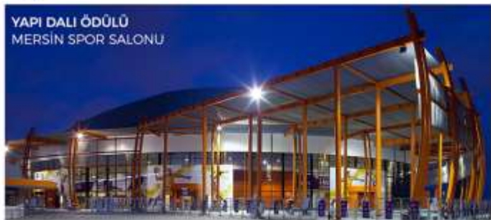
YAPI DALI ÖDÜLÜ MERSİN SPOR SALONU